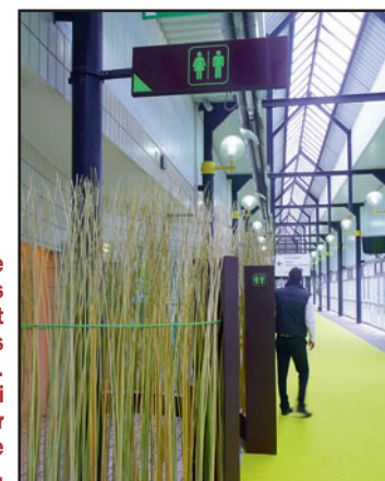
Une signalétique performante et des jolies «haies» d'osiers marquent l'entrée d'un pôle très fréquenté du salon... repérable aussi malheureusement par d'autres moyens, tels que l'odeur et le sol inondé...