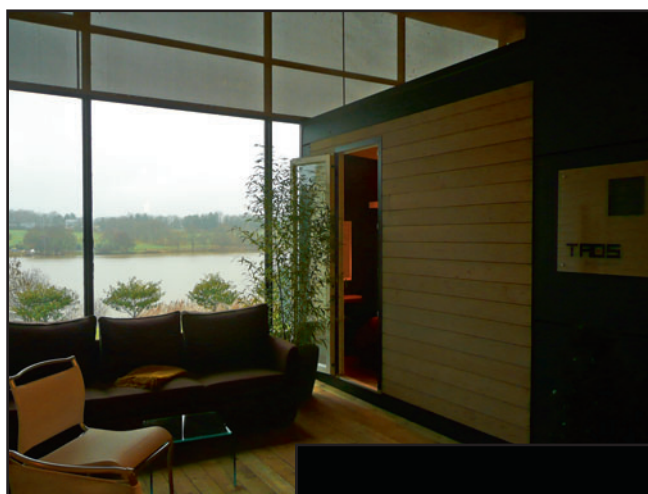
Curieusement, les mobil-homes exploitent peu le cadre extérieur du parc de la Beaujoire, et disposent leurs modèles en un «U» qui tourne le dos au paysage des bords de l'Erdre. Ce constructeur breton a su mettre à son profit ce décor naturel pour constituer un village... non pas d'irréductibles gaulois, mais d'indiens Taos.