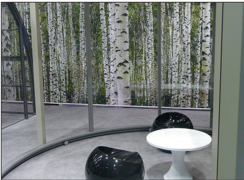
Dommage qu'il n'y ait pas eu de prix du décor pour cette édition, car la forêt de bouleaux Abrisud aurait eu ses chances. Design épuré, inspiration nature. On aime!

déroule en parallèle de CampoOuest pour une durée contractuelle de trois ans, il faut quand même donner aux visiteurs un trait de nouveauté et d'originalité. Le challenge a été réussi cette année, avec la création au sein du hall 2 d'un vaste espace de 200 mètres carrés consacré au «wellness» répondant à une tendance importante du marché de l'hôtellerie de plein air, agencé et mis en décor par le bureau d'études spécialisé Akwa Inéo. En poursuivant encore dans la direction de l'innovation, les responsables de CampoOuest ont d'ailleurs décidé cette année d'attribuer trois «trophées de l'innovation» en lieu et place des trois prix du plus beau stand, du meilleur accueil et du produit innovant, décernés les précédentes années. Ont été primés le constructeur vendéen Ridorev', cette fois pour son concept de mobil-home low cost en toile et bois baptisé Natur'; la société Jean Becker pour ses plaques de patinoire «sans glace et sans énergie consommée» en polycarbonate renforcé; et l'entreprise Concept Home pour un concept de bungalow design intégrant un pôle wellness. Décidément, c'est dans l'air du temps! ■