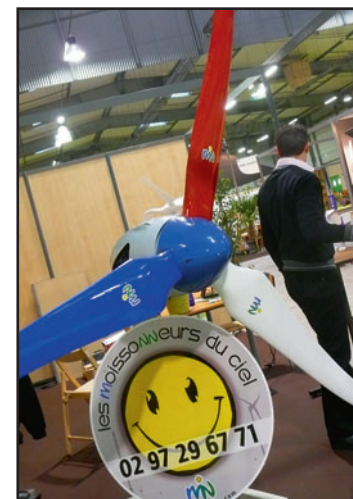
Joli nom pour des éoliennes individuelles...