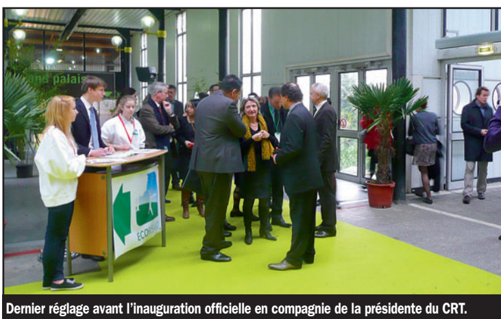
Dernier réglage avant l'inauguration officielle en compagnie de la présidente du CRT.