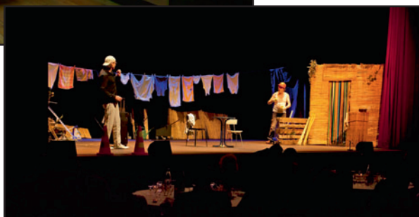
Soirée «Au Théâtre ce soir»... Les décors ne sont pas de Roger Hart, pas plus que les costumes des convives de Donald Cardwell... Mais l'ambiance est au rendez-vous.